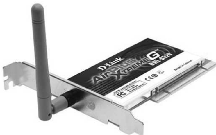
Рис. 1.2: Внешний вид адаптера Wi-Fi

Основная архитектура, особенности и службы 802.11b определяются в первоначальном стандарте 802.11. Спецификация 802.11b затрагивает только физический уровень, добавляя лишь более высокие скорости доступа.